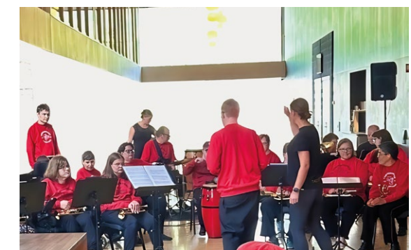
VELKOMST TIL FESTMIDDAGEN: Under innmarsjen til jubileumssmiddagen spilte TrønderBraZZ

LUPE Trøndelag sin jubileumskonferanse var en påminnelse om organisasjonens betydning i lokalsamfunnet, og om det store engasjementet deres for en bærekraftig og inkluderende fremtid. Det var vel unt at markeringen ble avsluttet med en festmiddag, akkompagnert av musikk og sang fra Dagfinn Gården.