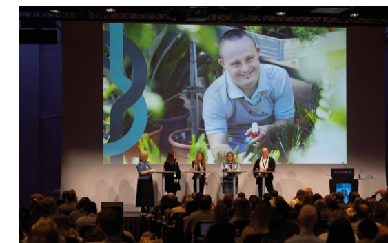
DELTE ULIKE PERSPEKTER: Paneldeltagerne bidro med erfaringer knyttet til sitt fagfelt.