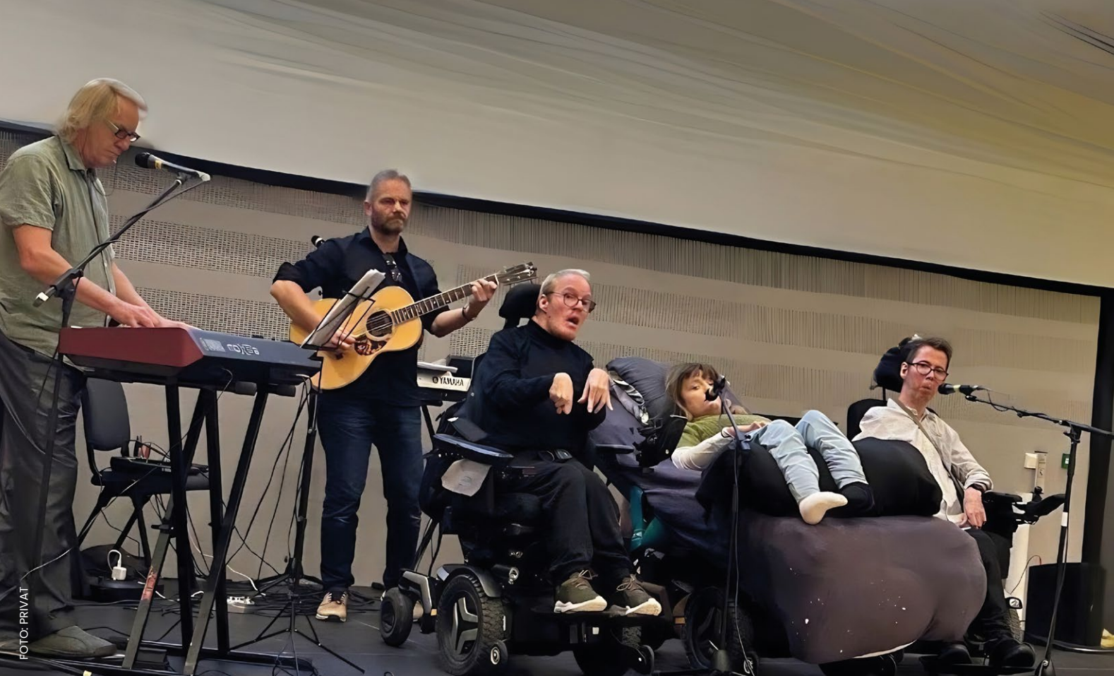
MUSIKALSK INNSLAG: Bandet «Vi invalide» åpnet den andre delen av konferansen.