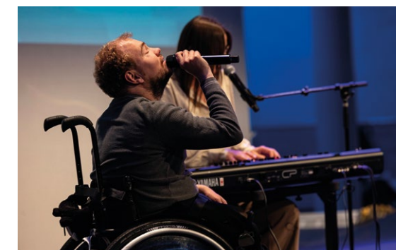
MUSIKKLEDE: Medlemmer av «Dissimilis» stod for et flott kulturelt innslag.

Med et bredt spekter av perspektiver og utfordrende spørsmål leverte SOR-konferansen en vellykket og innsiktsfull opplevelse. Som alltid satte de sammen et program som engasjerte og inspirerte – og som har gitt mye å reflektere over for alle involverte i tjenester for personer med utviklingshemming.