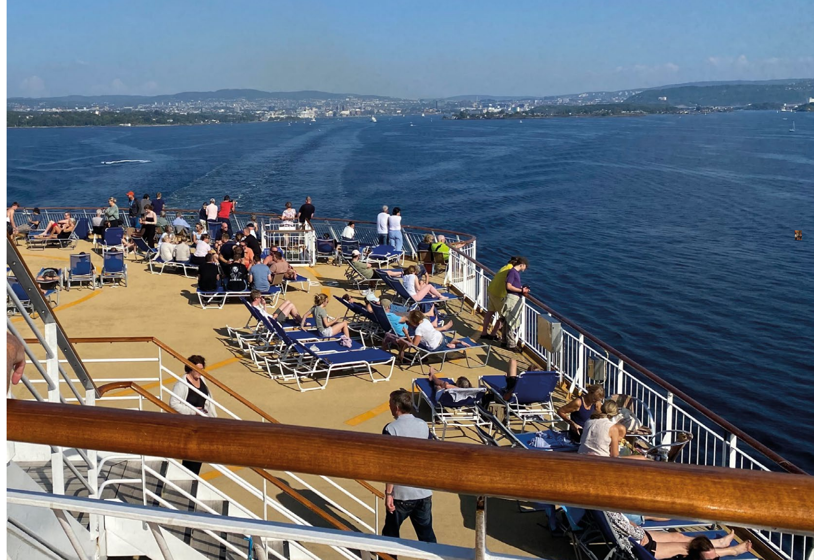
NYDELIG SENSOMMER DAG: Det var bare å nyte finværet på soldekk under utseilingen fra Oslo.

Tidlig på kvelden samlet vi oss til middag i Grand Buffet. Her kunne vi nyte et utvalg av smakfulle retter og fristende desserter. Etterpå ventet et fargerikt show i teatersalen, her hadde vi reservert plasser på forhånd. Vi fikk servert kaffe avec. For noen fortsatte kvelden med dans til levende musikk, mens andre benyttet anledningen til litt taxfree-shopping.