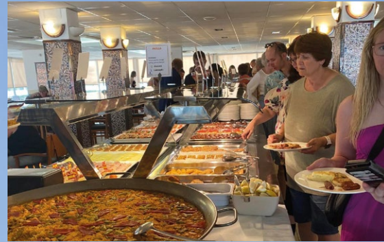
SUNN OG GOD MAT: På Solgården fikk deltagerne servert tre bærekraftige måltider med masse friske grønnsaker hver dag.

Tjenesteyterne i kommunene bør få muligheten til å oppleve dette, og yte nødvendig støtte, både økonomisk og gjennom tilbud om ledsagerordninger.