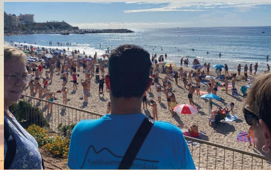
BADESTRANDEN I BENDIDORM: En stor gruppe mennesker trener i herdig.

Kveldsaktivitetene på festplassen fortjener å fremheves! Her fikk våre utviklingshemmede stå på scenen foran et publikum på omtrent 200 mennesker. Det var en rørende opplevelse å se dem uttrykke seg gjennom sang, dans og musikk, og vise frem en annen side av seg selv i et trygt og støttende miljø. Mange av dem oppviste adferd som var helt annerledes enn den de viser hjemme.