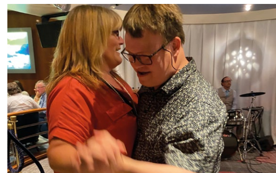
KULINARISKE GLEDER OG LEVENDE MUSIKK: Maten smakte fortreffelig, og etterpå var det dans til levende musikk.