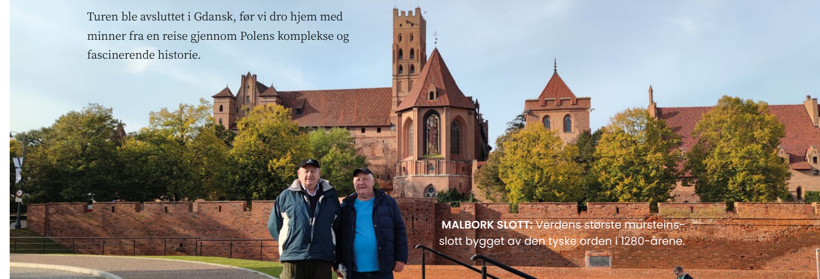
MALBORK SLOTT: Verdens største mursteins-slott bygget av den tyske orden i 1280-årene.

KWIDZEN SLOTT: Ble bygget på 1300-tallet og brukt som møtehus av Kong Wladyslaw II Jagiello under kampene mot de teutoniske ridderne.