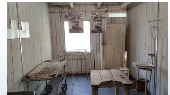
GUFS FRA FORTIDEN: Stutthof konsentrasjonsleir.