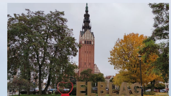
ELBAG BY: Grunnlagt av den tyske orden i 1237, og er kjent for sin industrielle og kulturelle betydning.