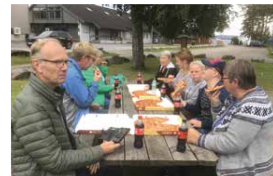
UTE I NATUREN: Det var god stemning rundt matbordet.