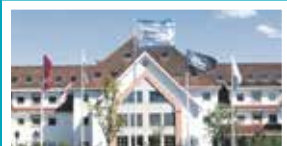
Olavsgaard Kontorsenter – Skedsmo Hvamstubben 17 – 2013 Skjetten

Du skal vite at vi er der og du skal vite hvor vi er