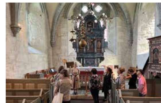
KLOSTERKIRKEN: Guiden forteller om interiøret i Klosterkirken, blant annet altartavlen og prekestolen fra tidlig på 1600-tallet.