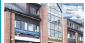
Jessheim – Ullensaker Gotaasgarden, Gotaasalléen 9