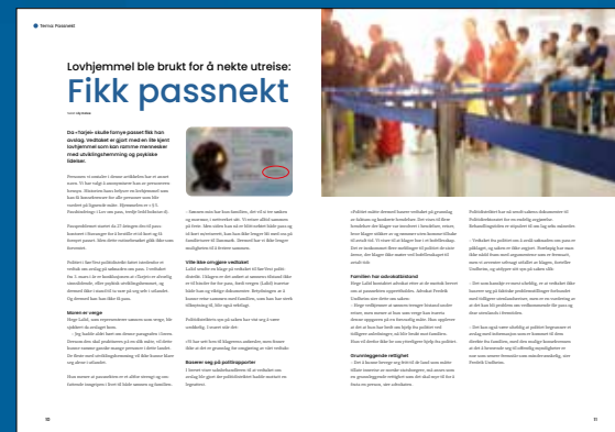
FAKSIMILE: Under Lupen nummer 3 2023.