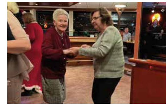
DANS OG MORO: Etter et meget smakfullt julebord var dansen i full gang.

Lørdag kveld ble kronet med et gedigent julebord. Hotellet var overfylt av gjester, men vi var heldige og hadde tilgang til et eget lokale (som ble brukt til