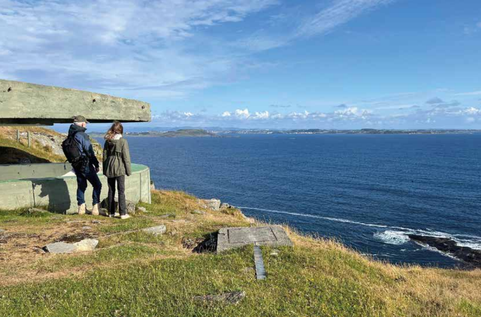
VIDSTRAKT UTSIKT: Fjøløy fort er blitt et populært turmål etter at det ble åpnet for publikum i 2009. Her er utsikten mot Stavanger fra en av kanonstillingene på fortet.

Restauranten har en fin beliggenhet like ved sjøkanten med flott utsikt utover fjorden. Ved hotellkaien ligger seilskuta «Restauration», en tro kopi av sluppen som ble brukt av utvandrere til Amerika i 1825.