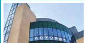
Bekkestua – Bærum Bærumsveien 205–207