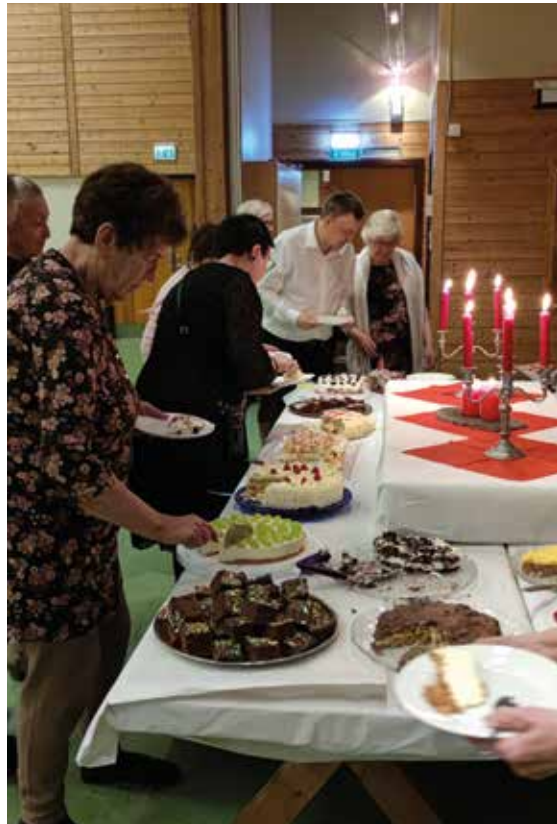
EN STRÅLENDE KVELD: Deltagerne på julebordet fikk servert nydelig mat og kaker, gode innlegg, musikk og dans.