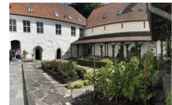
SJELDENT KULTURMINNE: Utstein Kloster på Klosterøy er Norges eneste bevarte kloster fra middelalderen. Her hadde Harald Hårfagre sin kongsgård.