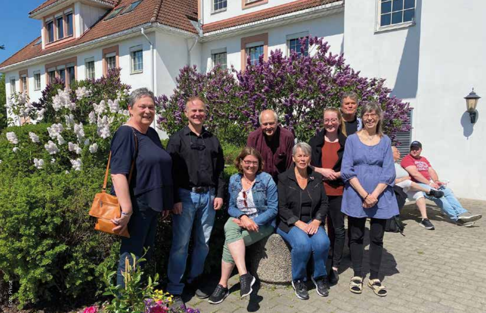
INVITERER TIL SAMLING: Sentralstyret i LUPE arrangerer likepersonssamling og ledermøte 7.-9.juni.