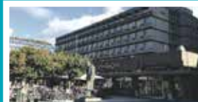
Solli Plass – Oslo Henrik Ibsens gate 90, 3. etg.