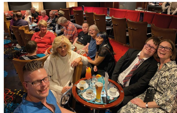
MATGLEDE: Det var mye smil og latter blant deltagerne, som fikk servert utsøkt mat og drikke.