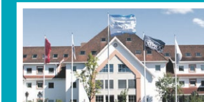
Olavsgaard Kontorsenter – Skedsmo Hvamstubbene 17 – 2013 Skjetten

Du skal vite at vi er der og du skal vite hvor vi er