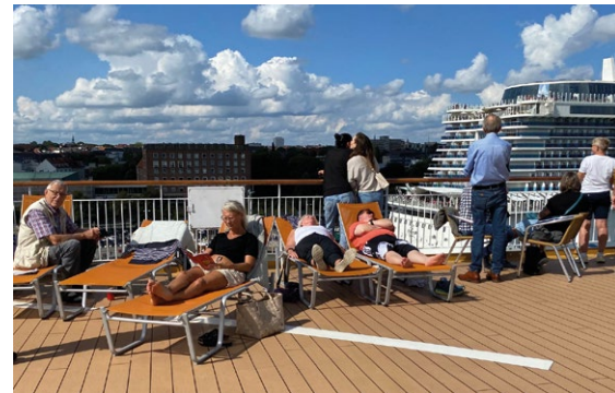
PÅ SOLDEKKET: Mange koste seg på båtdekket i det nydelige været.

Den fine «turgjengen» hadde en kjempefin og hyggelig tur som frister til gjentagelse.