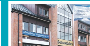
Jessheim – Ullensaker Gotaasgarden, Gotaasalléen 9