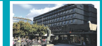
Solli Plass – Oslo Henrik Ibsens gate 90, 3. etg.