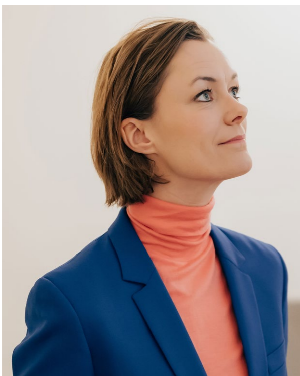
STATSRÅD: Anette Trettebergstuen.

4.november var en stor dag, for da la regjeringen frem en etterlengtet stortingsmelding som tar for seg mange rettighetsområder. Det ligger mange års arbeid bak denne meldingen, som er blitt laget